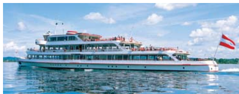
MS »Vorarlberg« 61,95 m, 1.000 Pers.

Geniessen Sie die Fahrt über die Weite des internationalen Bodensees. Ihr Blick schweift in die Ferne, Sie entdecken schneebedeckte Berge und die Silhouetten lebendiger und intakter Ortschaften. Lassen Sie sich während der Fahrt von der gepflegten Bordgastronomie verwöhnen.