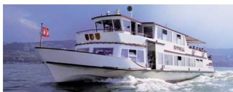
MS »Rhyegg« 31,15 m, 300 Pers.

Vorarlberg Lines-Bodenseeschiffahrt VLB Schweizerische Schiffahrtsgesellschaft Untersee und Rhein URh SBS Schiffahrt AG – Romanshorn SBS SBS Schiffahrt AG – Rorschach SBS Bodensee-Schiffsbetriebe GmbH BSB