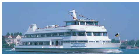
MS »Graf Zeppelin« 56,25 m, 700 Pers.

Die stolzen Schiffe der weissen Flotte verbinden auf ihren Fahrten die schönsten Ausflugsziele am Bodensee. Dank eines attraktiven Fahrplans erreichen Sie die Städte und Dörfer direkt und ohne Umwege – und sparen erst noch Zeit.