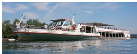
MS »Munot« 49,90 m, 580 Pers.

Wir sind mit unserer Flotte für Sie da – herzlich willkommen an Bord!