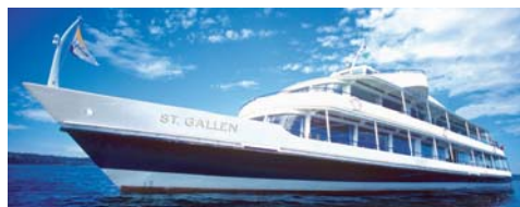
MS »St. Gallen« 51,20 m, 650 Pers.

Sonder- und Ausflugsfahrten machen den Aufenthalt auf dem Wasser zum Erlebnis. Fünf Gesellschaften mit 32 Fahrgastschiffen und drei Fähren bringen Sie ans Ziel. 18.500 Sitzplätze bieten Platz für immer neue Ausflüge und Entdeckungsreisen.